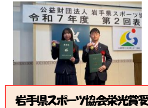
岩手県スポーツ協会栄光賞受

[第33回大沼杯小学生ハンドボール大会] 優勝+優秀選手 矢野フェニックス(見前南小)